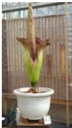
7/6 木曜日 開花