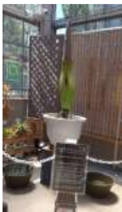
7/2 日曜日 蕾

東山公園でも10年以上もの間何度か空振りを繰り返し続きやっと蕾が出来そしてビデオカメラのスイッチオン。係の方は、まるで子供を大事に育てている様子でした。