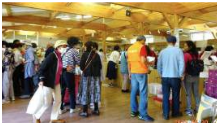
クーポン券利用でお土産を