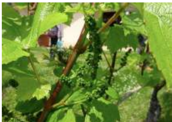
これがワインの元