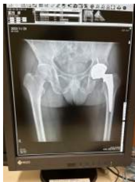
手術後（11月）のレントゲン写真