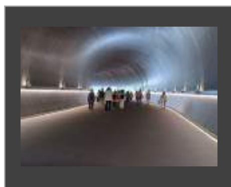
奨励賞（写真） トンネルを抜けると 成田双美代