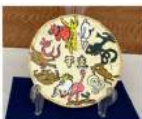
陶板画・十二支 横山一郎