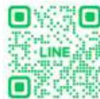
旅行部会 Line QR コード