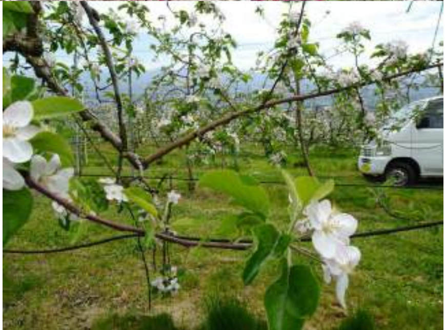
りんごの花 (三和観光農園)