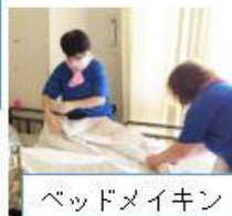
ベッドメイキング