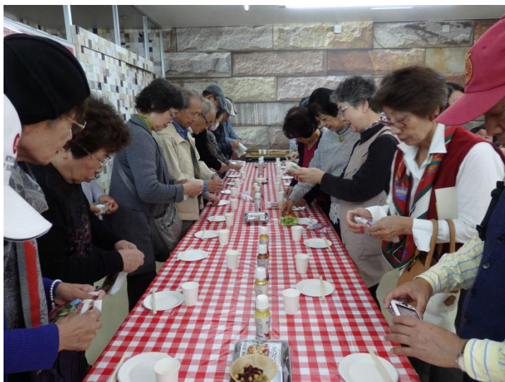
キューピーマヨネーズドレッシングの試食

三番目は「豊田市美術館」で美術鑑賞です。近代芸術の彫刻・絵画に首を傾げるばかりの美術鑑賞になりました。時間の関係で「トヨタ会館」はスキップして6時前に帰着しました。皆さまお疲れ様でした。