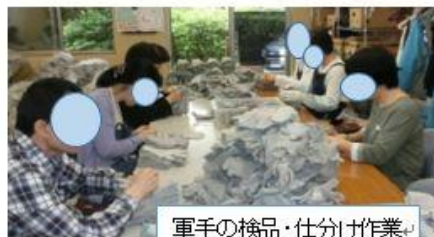
軍手の検品・仕分け作業⇨