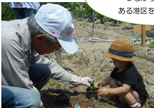
「つながり・交流部会」 共生型サロン 陽まわり