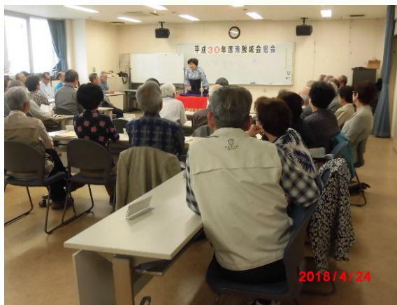
三遊亭はぼたんさんの落語