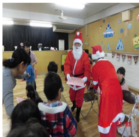
サンタクロース派遣事