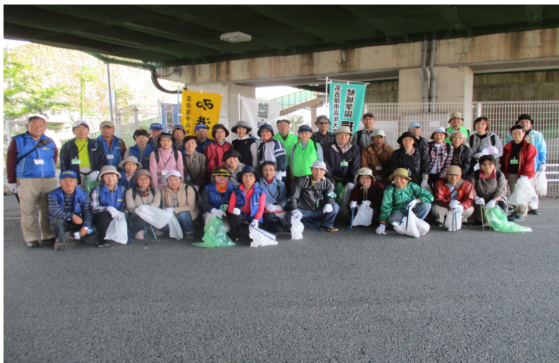
堀川クリーン大作戦