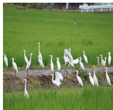
港区南陽町田園（しらさぎの群れ）

港区は16区で最大の面積ですが、港区には天白川、大江川、山崎川、堀川、中川運河、荒子川、庄内川、新川、東小川、戸田川、福田川、日光川が流れております。川向こうに行くためには、橋まで行かなければならず、行動範囲が狭くなりがちでした。これが面積の割りに港区在住の鯨城学園学生が少ない一因ではないかと考えます。