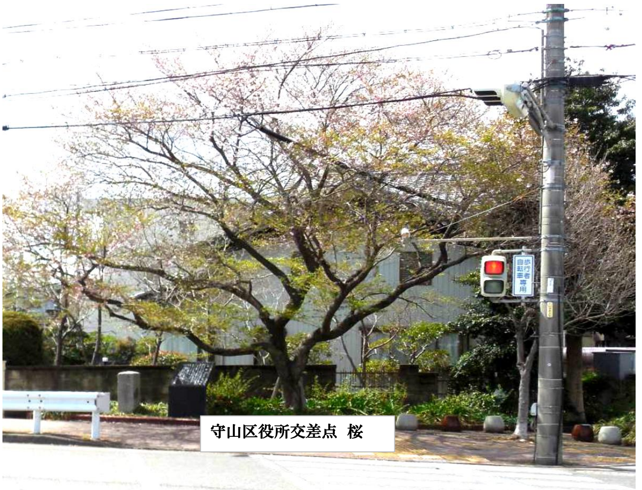
守山区役所交差点 桜