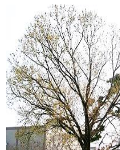
(守山区の木 ドングリ)