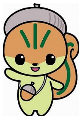
(守山区のマスコット モリスちゃん)