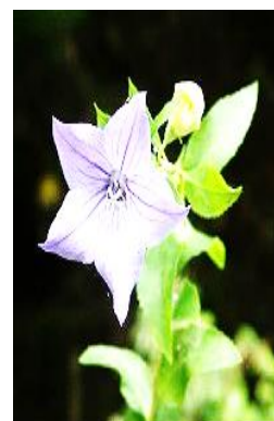
(守山区の花 キキョウ)