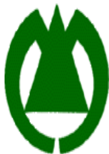
(守山区の シンボルマーク)