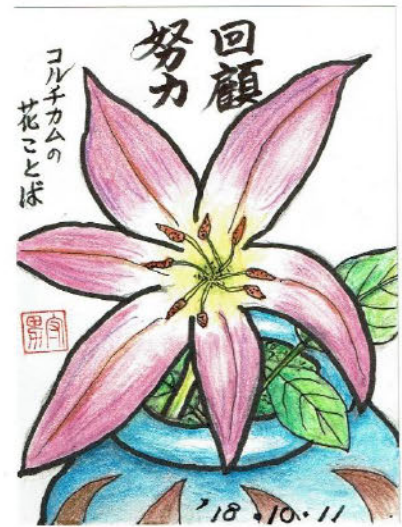
(大村さん作品:原画はカラー)