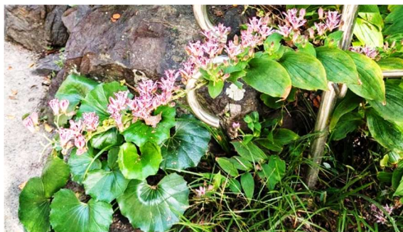
東山さんさくで出会ったホトトギス

余談になりますが、毎月末水曜日に行われている東山散策に参加の時に、素敵に咲いているホトトギスに出会いました。