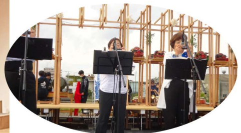
2025-11-02 地域祭 シシシ祭り