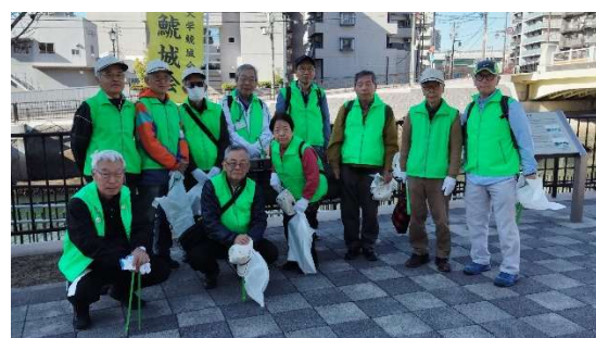
堀川清掃大作戦参加者