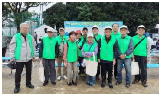
区民祭り清掃活動