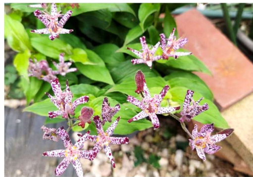
我が家のホトトギス