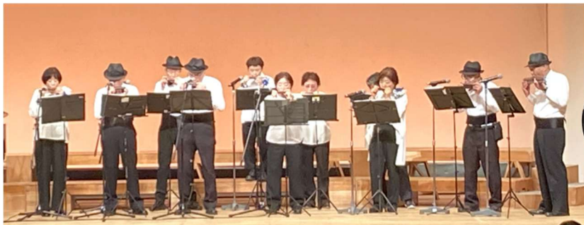
2025-11-29 なかがわ文化祭 中川文化小劇場

これからも一層充実した 演奏会なりますよう、メニューを増やしていきたいと思ひます。