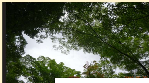
森の中から空を見る 万華鏡の様