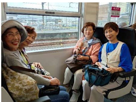
天竜浜名湖鉄道車内