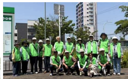
荒子駅前周辺清掃