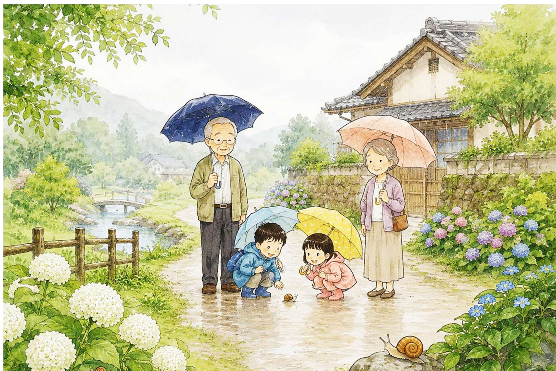
雨の日の庭散歩 AI生成イラスト 白草大三