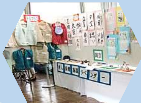
老人・保健・施設 ラベンダー