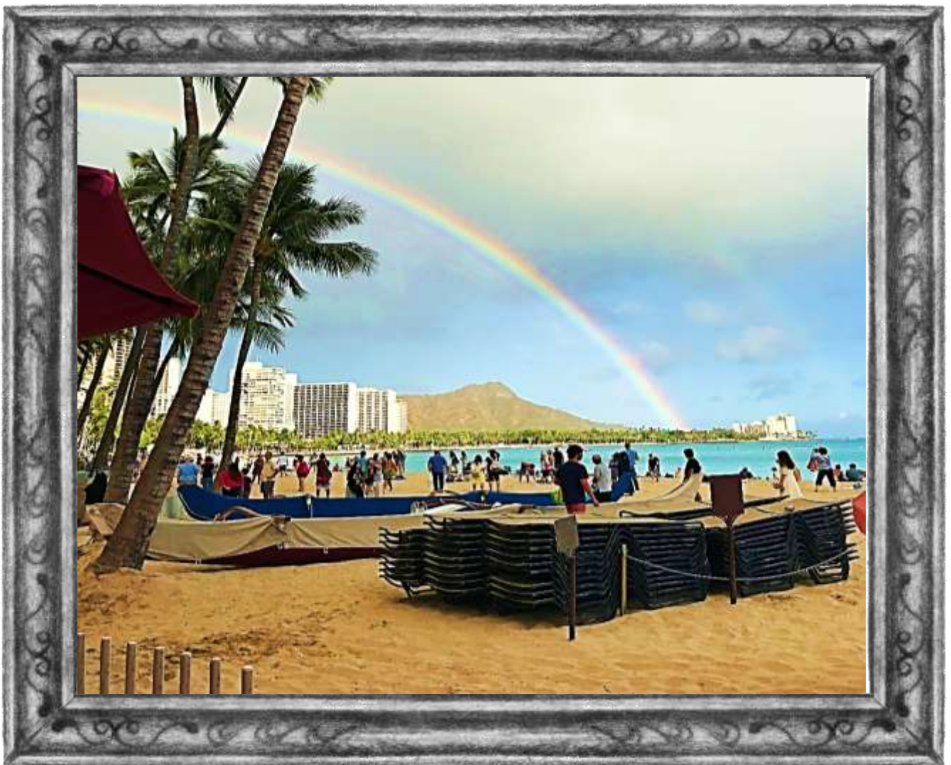
『ハワイ、ワイキキビーチ』 穴井千恵子 (29期 国際A)