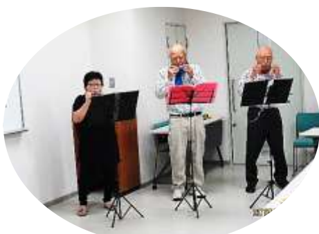
ハーモニカを楽しむ会・演奏