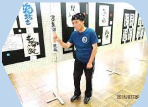
土門琳・筆文字のアート書道説明