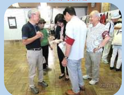
中日新聞掲載の打合せ