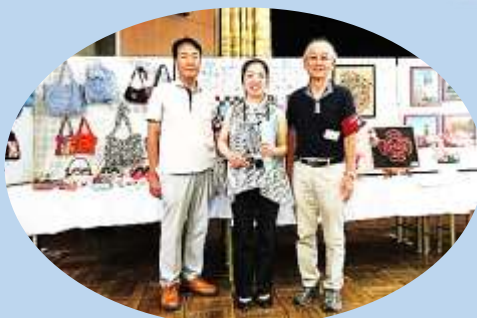
中日ホームニュース来場