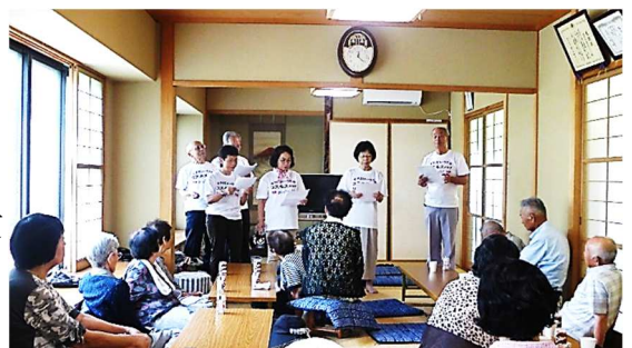
富永老人会でのボランティア活動