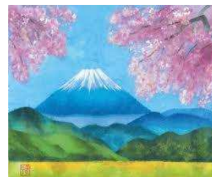
(ちぎり絵イメージ)