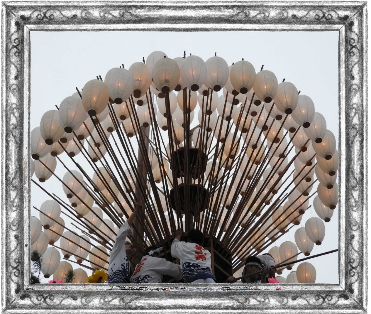
『祭りの 明りを灯す』 小寺奎次 (28 期 生活 B)