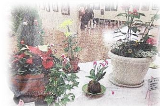
第17回作品展 中日新聞掲載