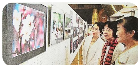
第16回作品展 中日新聞掲載