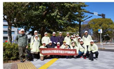
ウイメンズマラソン ボランティア参加者