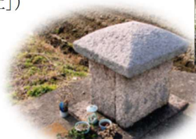
田の神 田んぼの畦に祀られた田の神。形はさまざまなものがあります