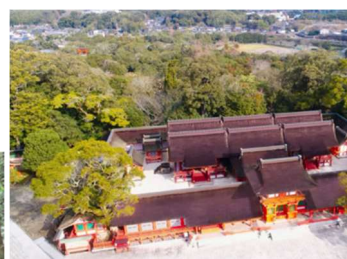
宇佐神宮（大分県） 八幡社の総本山