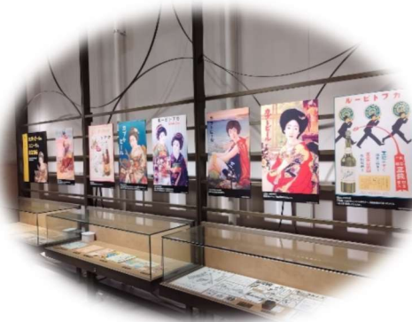
赤レンガ建物内歴史写真・ ボランティアガイド説明風景