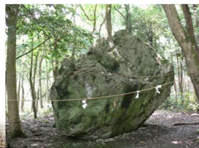
出雲大神宮 （京都府）に祀られた岩