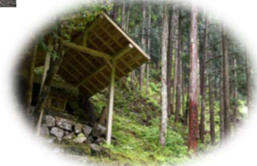
山の神 吉野川上村に祀られた山の神。ここは女性の神様