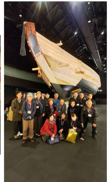
リニューアルした ミツカンミュージアム内部