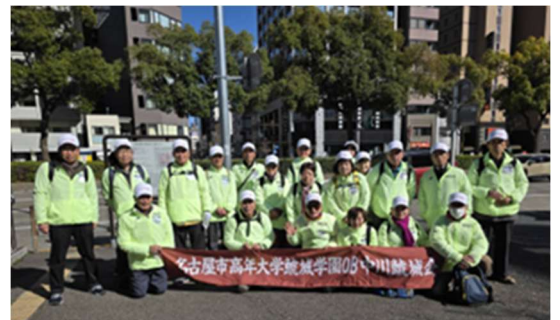
ウイメンズマラソン参加者