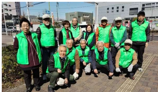
あおなみ線荒子駅 周辺清掃