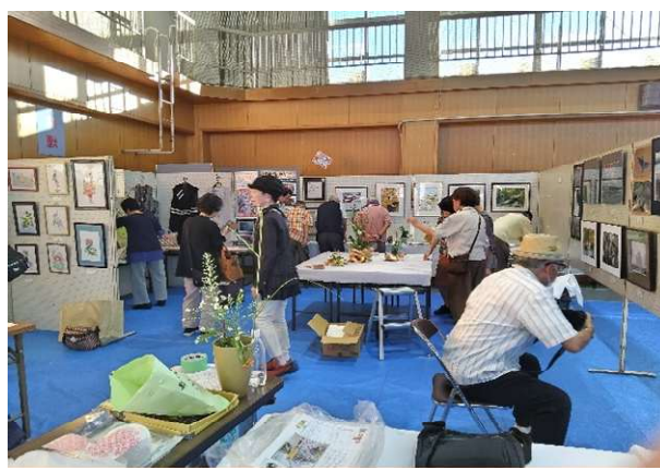
令和7年度の作品展会場