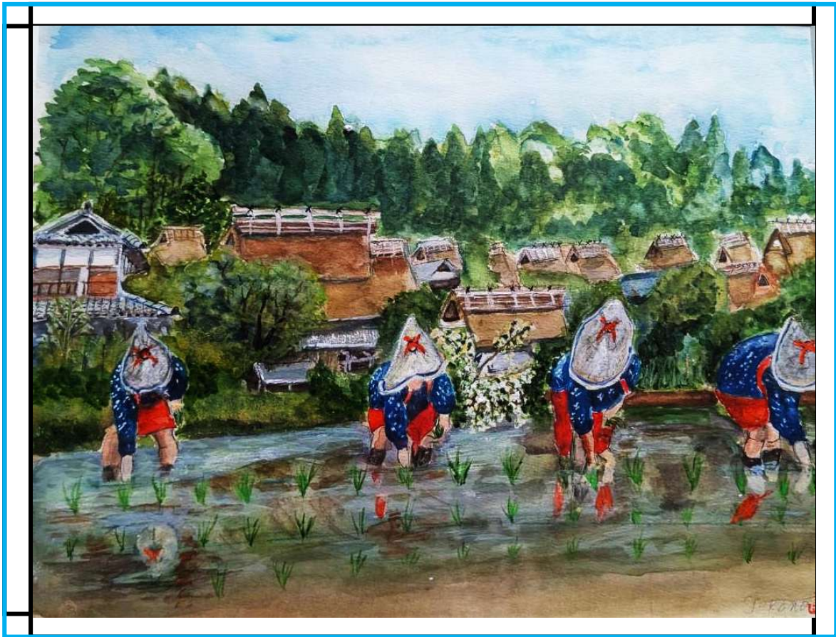
[かやぶきの里] 水彩画

京都深山町北山集落の早乙女達の田植え作業の様子を描いてみました。この地方では五穀豊穰祈願として早乙女達が菅笠にかすりの着物など身に着け、近くの神社で田植え神事を毎年の行事として執り行われるそうです。そして観光スポットとして早乙女達の田植えが喜ばれているそうです。この頃、田植えを含め農作業は機械化されているとの事で、このような田植え風景はいつまでも続けて欲しいなと思いました。