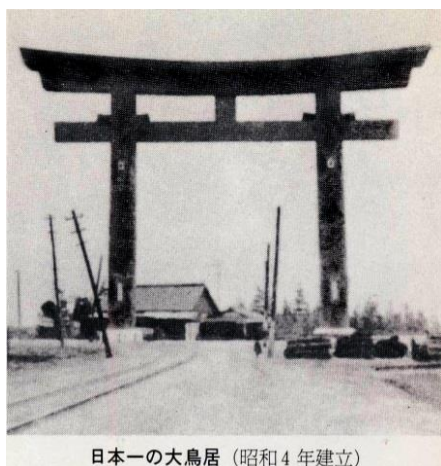
日本一の大鳥居（昭和4年建立）

中村地方が名古屋市へ併合された記念として昭和4年に建立され、以来この地の変遷を見続けてきたこの大鳥居と桜を1枚にしました。リニア—中央新幹線が建設され更に飛躍するこの地の発展と中村鯉城会の活動をこの大鳥居に見守ってもらいたいとの思いで投稿しました。建設当時、北側から南を向いて撮られた写真からこの地域の様子を見る事が出来ます。