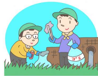
＜ 参加メンバー ＞