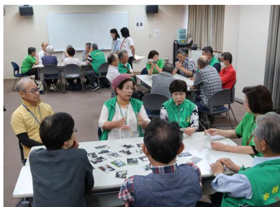
認知症予防回想法体験の様子（33期生と中村鯉城会メンバー）