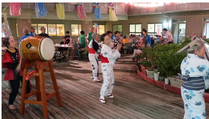
会場サポートメンバー