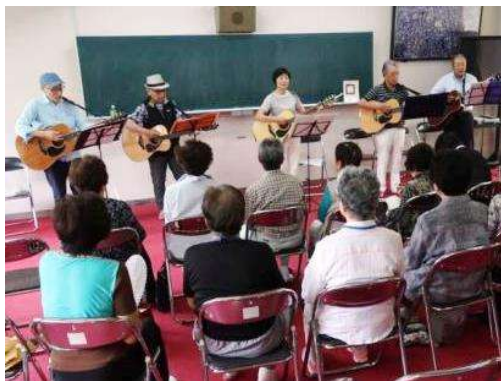
ギター・アンサンブル・ソサエティ

まだまだ未熟な私達ですが、皆さんと一緒に唄い、喜んで頂いたのが今後の励みとなりました。