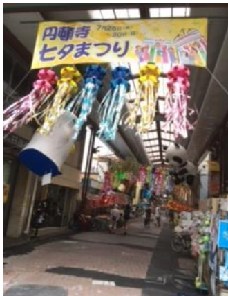
アーケードの様子

7月28日（金）に円頓寺商店街の七夕まつりに、「移動児童館」として参加し、楽しい時間を過ごしました。