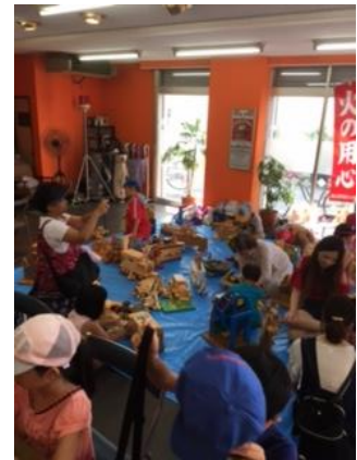
会場内では 木のおもちゃで遊びました

西こじょう会・西児童館・円頓寺商店街のコラボが実現しました！ 今後も、楽しいイベントを企画したいと思います