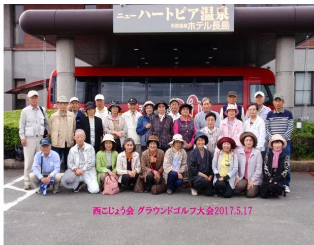
大会会場に集う参加者28名

29年度前期大会は5月17日に28名の参加で「ニューハートピア長島」にて開催しました。上小田井駅からの送迎バスは満席すし詰め状態。現地到着後早々に1グループ4名の計7グループに分かれて日頃の練習で磨いた腕を競い合いました。