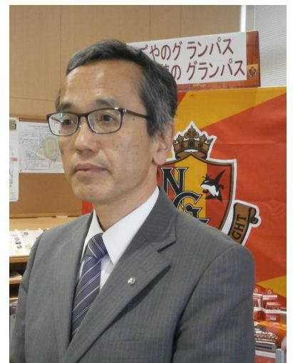
(グランパスの旗の前にて)

ところで、みなさんの活動の中で、ドラゴンズ同好会があると知りました。さすが地元だと感じましたが、グランパス同好会はないのかなと気になりました。私はドラゴンズ同様にや現在はそれ以上にグランパスに入れ込んでおります。車のナンバーも「7588」ナゴヤ（グランパス）エイトにしています。今季は残念ながらJ2での戦いを強いられています。すぐにJ1に復帰するものと信じて、応援を続けています。みなさんがたの中にもきっとグランパス愛にあふれた方がいらっしゃることでしょう。ドラゴンズ同様、応援していきましょう。