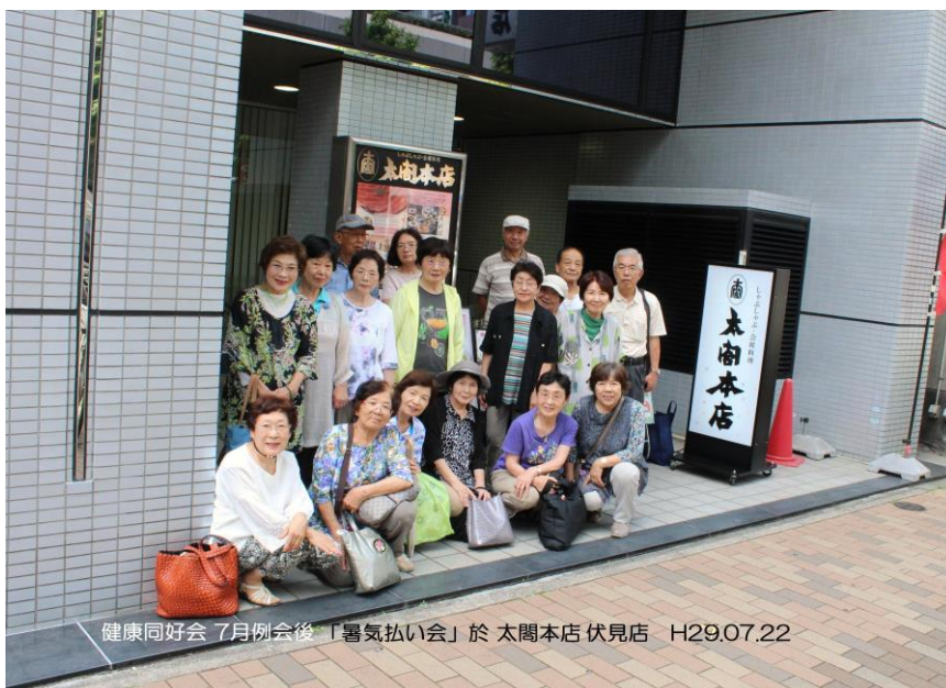
健康同好会 7月例会後「暑気払い会」於 太閤本店 伏見店 H29.07.22