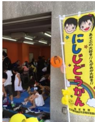
イベント会場前・・・ 子供さんで溢れています