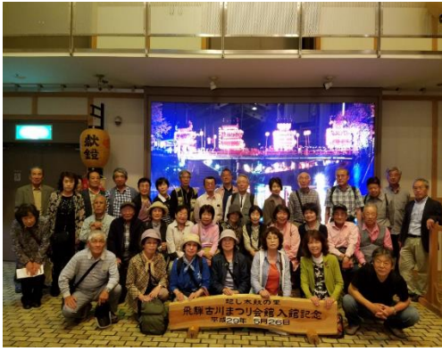
飛騨古川まつり会館にて