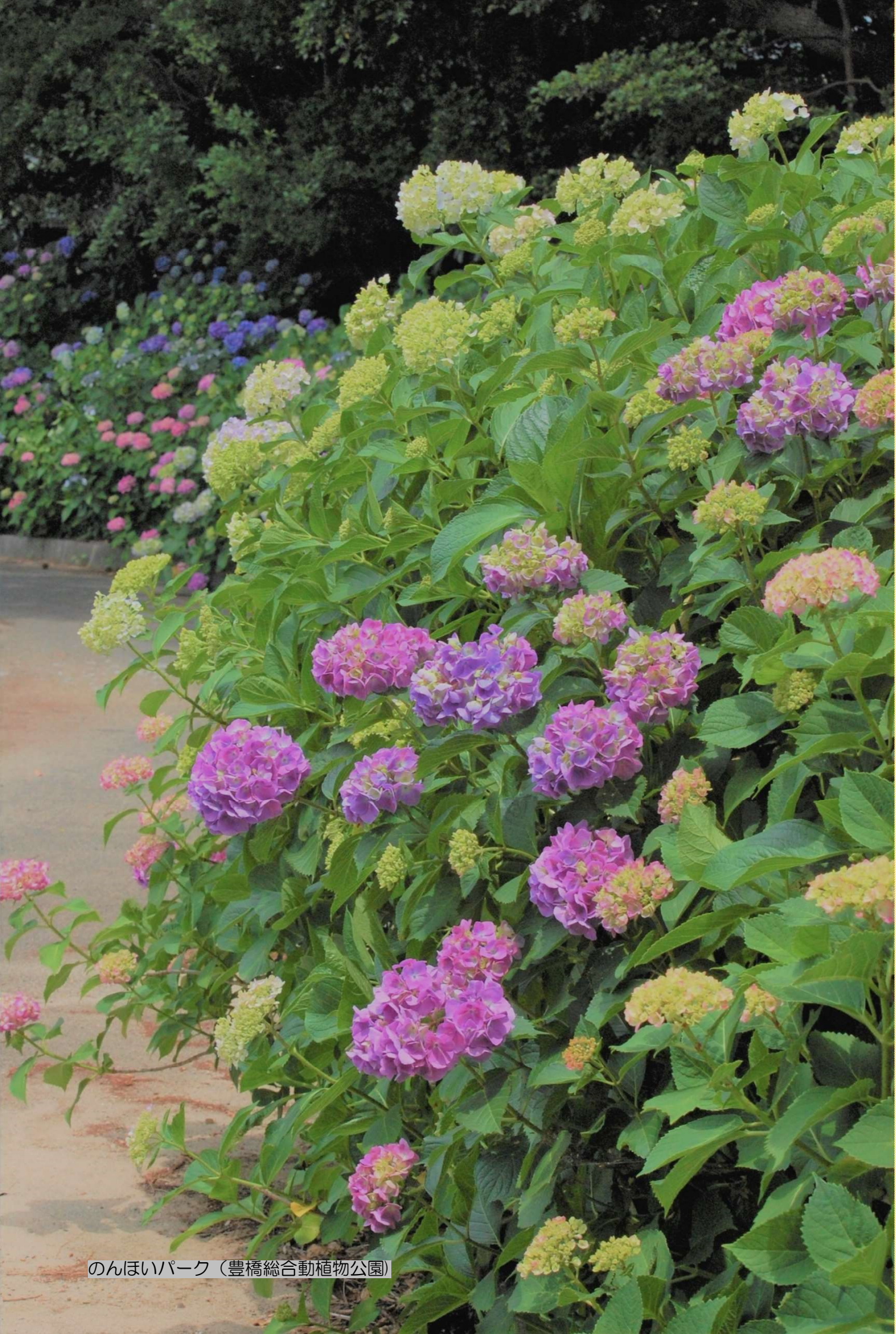
のんほいパーク（豊橋総合動植物公園）