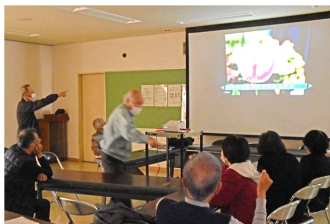
拡大映像で定例会の勉強

山田支所1階ロビーには会員の作品が1年を通じて欠かすことなく展示中です。山田支所管内を主に西区内を撮影対象にした作品です。一度に5~6点を展示し、2カ月毎に差し替えています。支所来所者にはかなりの好評を頂いていると伺っています。山田支所や山田図書館にお越しの際は、是非見てやってください。