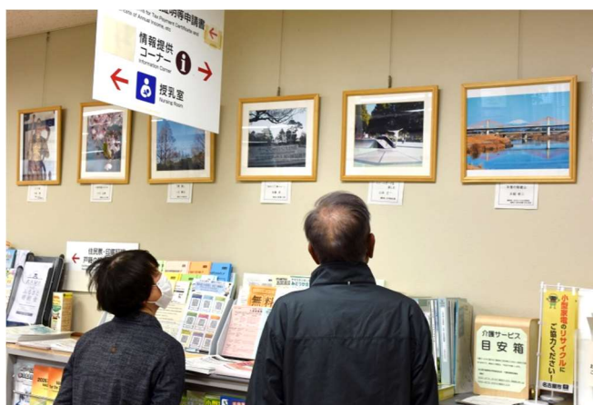
山田支所の展示写真を見入る人

写真左。この西こじょうだより117号が発行される頃には写真が入れ替わっています。