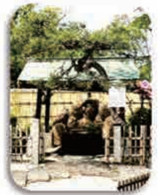
豊太閤産湯の井戸