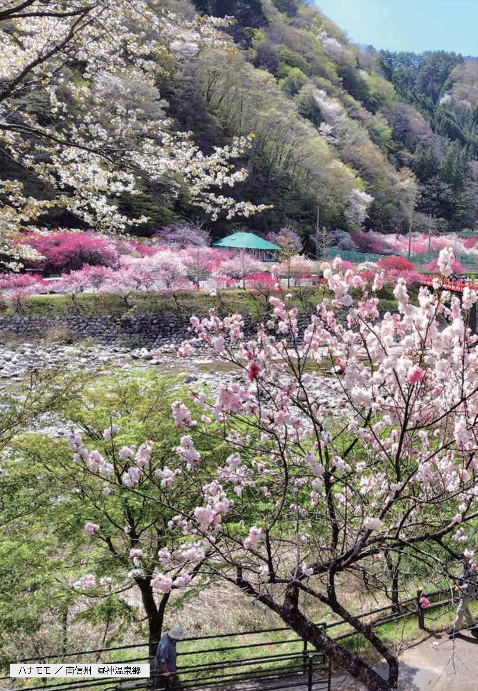
ハナモモ / 南信州 昼神温泉郷