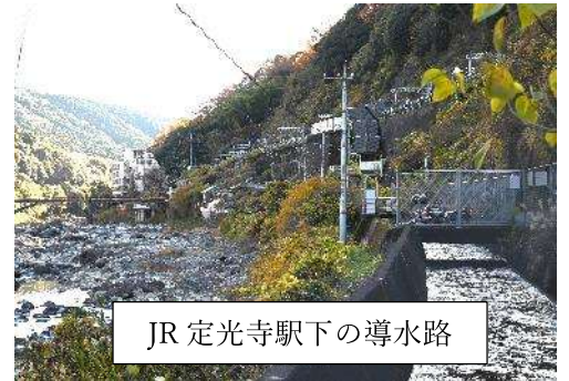
JR 定光寺駅下の導水路

路かなと思ってましたが、あとで晩秋に満水状態で勢いよく流れていたのには妙だと思い出して、その2～3年後には友人と用水路を辿ることにしました。