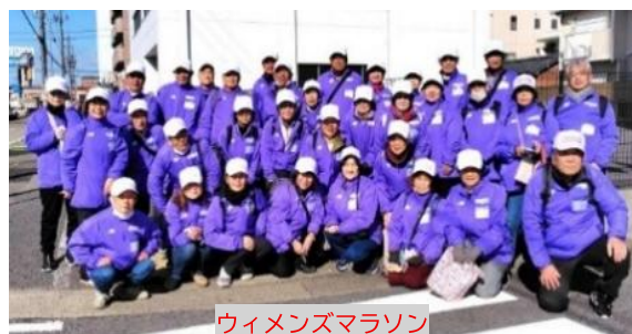
ウィメンズマラソン