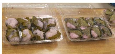
おいしそうな出来栄え