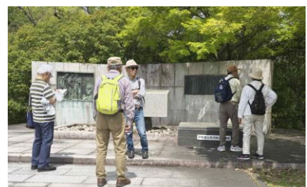
伊勢湾台風殉難者慰霊碑