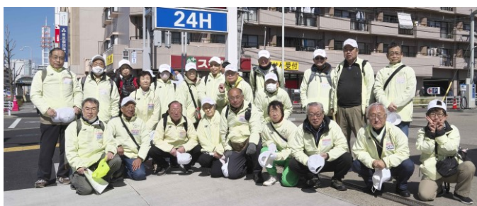
参加者で記念写真

最初に①「ホイールチェアマラソン」選手が通過。その後の②「ウィメンズマラソン」は先導車とテレビ中継車の後にトップ集団が続く。その後一般参加の集団となるが、それぞれに衣装や被り物に工夫を凝らしていて、見ていて楽しく、とても面白かった。参加者が楽しんでいる様子が伝わってきて微笑ましさを感じた。例を挙げると被り物では「あられちゃん」、「ピカチュウ」、「ビールジョッキ」、「(アンパンマン) と (ばいきんまん)」のペア、「(マリオ) と (ルイージ) と (クッパ)」の3人組など。次の③男女「シティマラソン」では、ジブリの「カオナシ」やドラゴンボールの「亀仙人」の衣装。それと「結婚式の挙式スタイル」の男女ペア(新郎はタキシードこそ着てはいないがワイシャツにベストと蝶ネクタイ、新婦はレースのスカート)が通過。