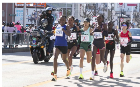
トップ集団の通過

多分10kmコースだと思うが、一緒にゴールできるように思わず祈って??? しまった。