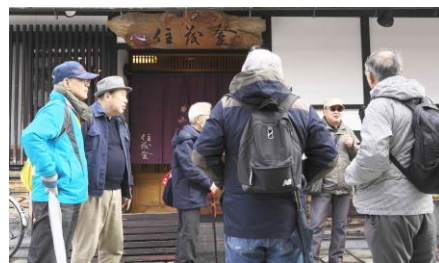
鴨料理の店「住茂登」

店は天然の真鴨を提供しているため値段は高いため、今回はフルコースの鴨料理は予算的に無理でしたので鴨鍋だけの料理でロースをしゃぶしゃぶで、だき身と骨つ