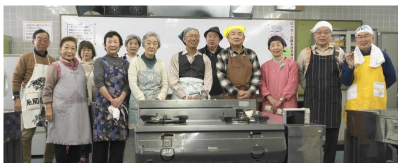
参加者で記念写真