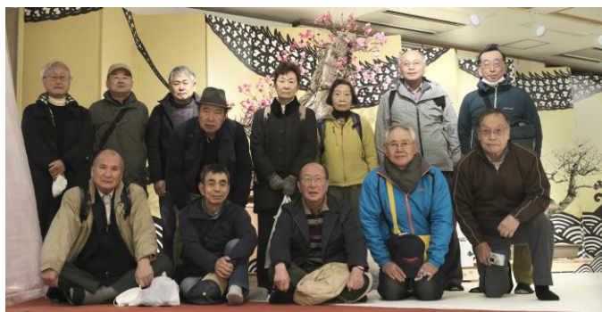
参加者で記念写真

くねは炊いて、醤油ベースのあっさり出汁で炊き上げ生卵で食べました。食べた感想はあくはまったく出ず嫌な臭みはありませんでした。食後は名古屋に戻る時間を皆さんそれぞれ、長浜別院大通寺、曳山会館、長浜城歴史博物館等を見学されました。