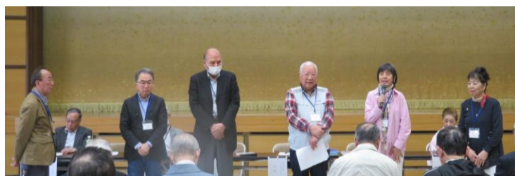
役員と新加入メンバーの紹介

その後、新役員の紹介と、37期生の新入会員3名（1名欠席）が自己紹介を行い、閉会となりました。