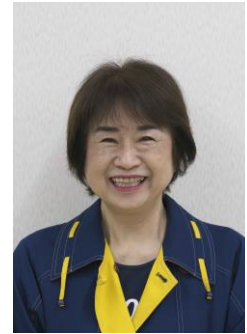
秋山ボランティア 副委員長

私たちは社会貢献ができていることを誇りに思いつつ、益々健康でいられることを願って活動していきます。