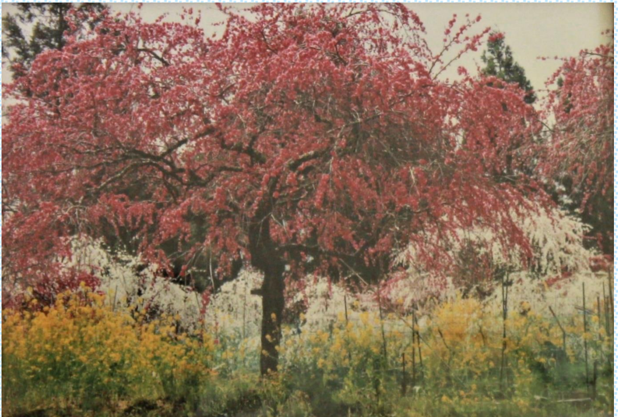
しだれ桃の里 (豊田市旭地区上中町)