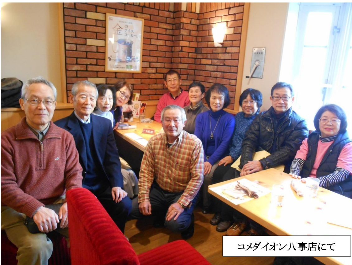
コメダイオン八事店にて

出来るときには、月1回配布の行事予定表をポスト投函しているのですが、まだ1度も顔を拝見したことのない方が数人いらっしゃるの、何とか拝見したいものと思います。よろしくお願いたします。