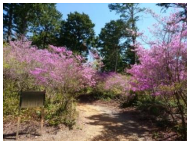
豊川市萩のツツジ