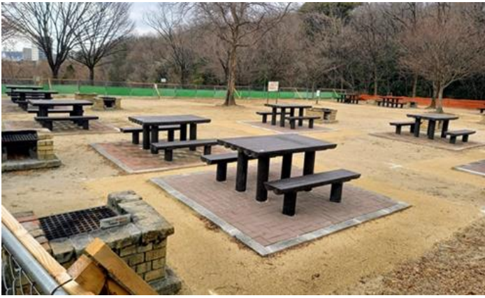
天白公園 デイキャンプ場 昨年末からの修繕工事で一新、 バーベキューコーナー（20基）