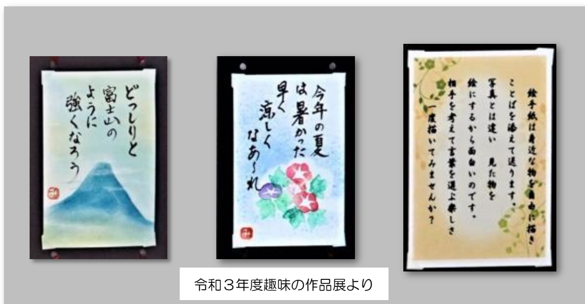
令和3年度趣味の作品展より