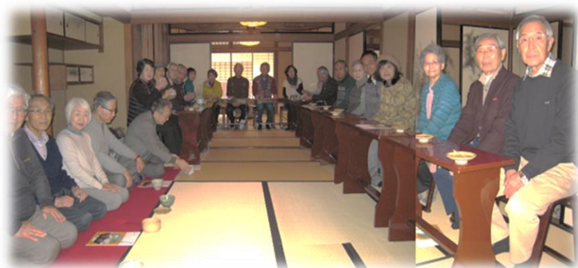
興正寺（茶室 竹翠亭）