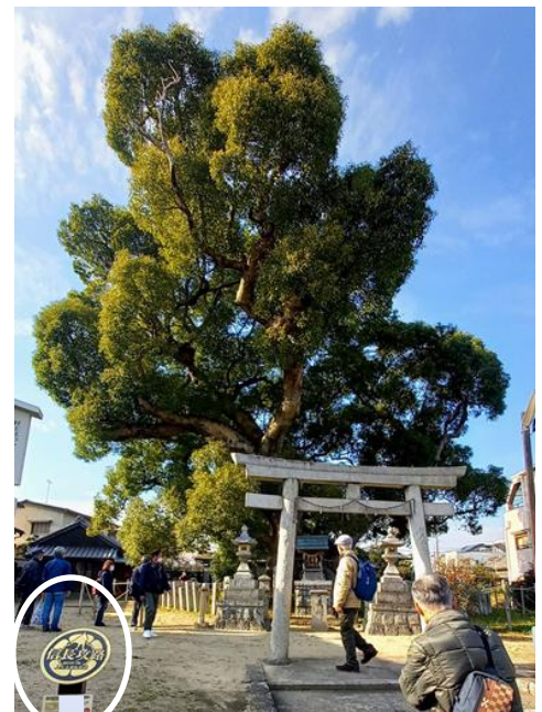
村上社の大楠