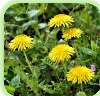
タンポポ