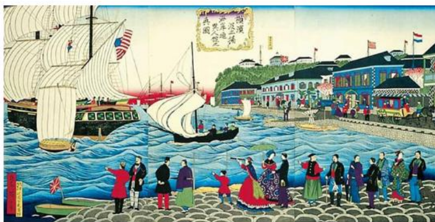
（横浜波止場ヨリ海岸通異人館図）