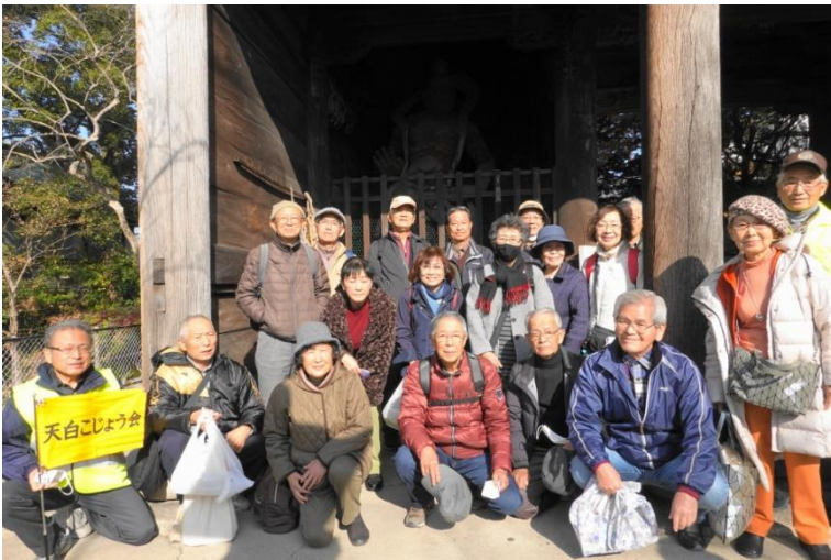
笠寺観音仁王門前にて

村上社は桜台高校の東側、閑静な住宅街の中にズドンと佇む推定樹齢約1,000年、高さ20m、幹周り20mの大楠で有名です。