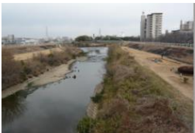
令和 4 年 2 月 1 日 新島田橋から上流を撮る