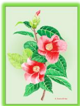
パソコン絵画：川島 英良