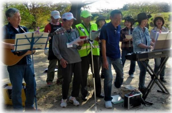
豊明花さき市場見学

私はまだ一年目ですが、次回からはより多くの皆さんに楽しく参加頂ける様、少しでもお手伝いさせて頂きたいと感じました。皆様もこれからも、楽しく、元気な天白こじょう会に積極的に参加しましょう。