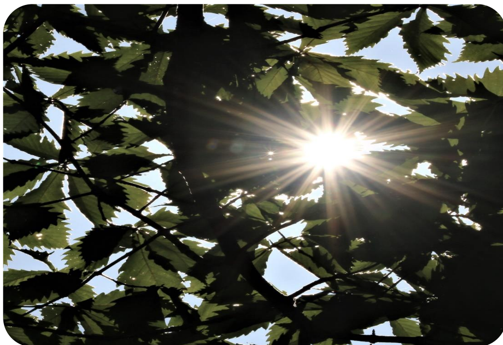
相生山の木漏れ日

特に最近では、新規加入者が減少しており、組織の運営に新たな検討課題が増え、ますます皆様のご協力を必要としております。よろしくお願いいたします。