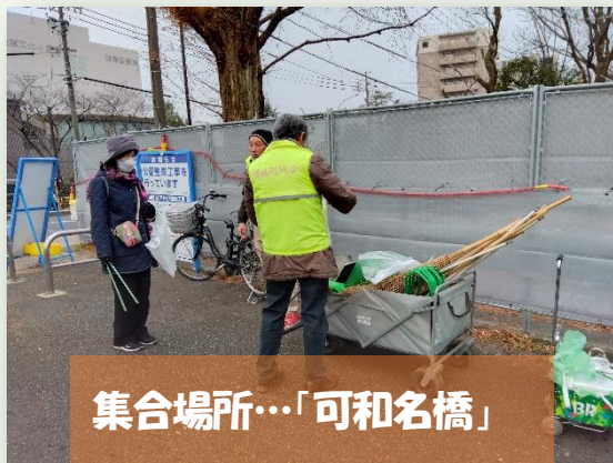
集合場所…「可和名橋」

来年のアジア大会に向けて大々的な工事が行われている為、以前のような清掃範囲は出来ませんが、毎回8名程の方に協力を頂いて活動を続けています。