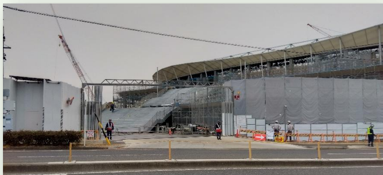
山下通沿い、グラウンドの南から北向きに撮影

瑞穂鯨城会のボランティア清掃活動もその間、工事状況により活動範囲の変更が余儀なくされていますが、工事の進捗状況を確認しながらの活動も楽しみです。