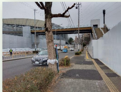
可和名橋より東向きに撮影