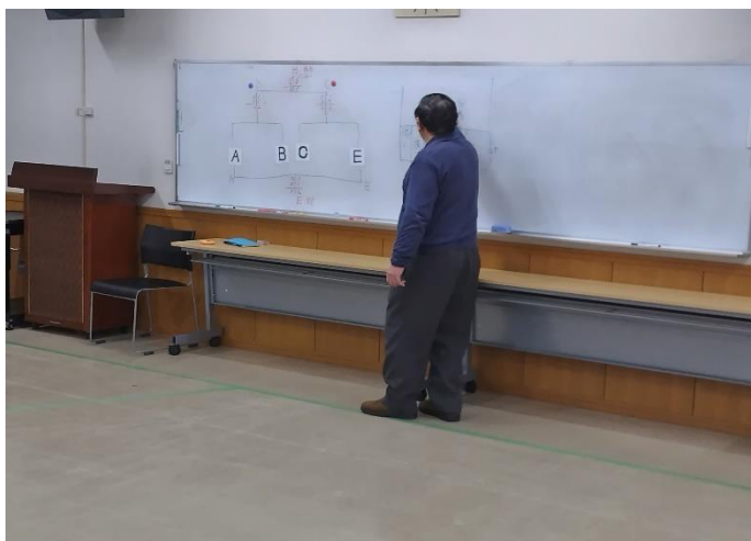
3人体制、4チームでの争い。記録二宮氏