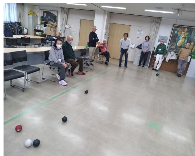
野田氏の投球(青色)