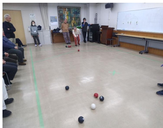
二宮さんの投球(赤色)