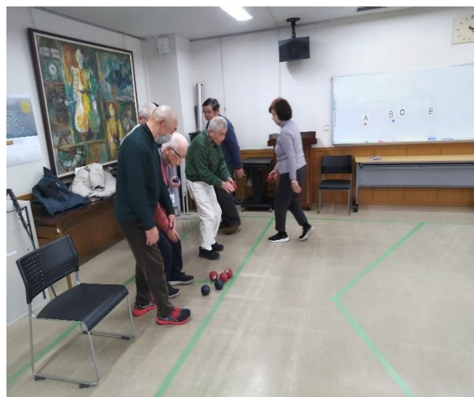
試合始前のボールの置く場所の準備