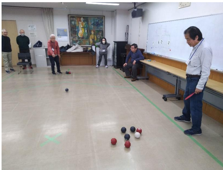
さあどちらのボールがと近いのか、しばし眺める