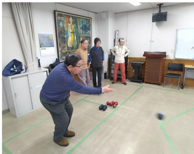
二宮氏の投球、どちらへころがったのか？