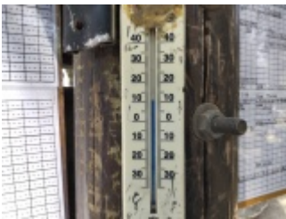
山頂では11°Cアウターを脱ぎ風も心地よく良い陽気。