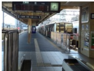
14:38普通栄行に乗車。空いた電車は休憩ベンチ、久しぶりの猿投山はやはり疲れた。