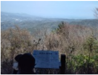
山頂の定点観測地点、冬季なら白山ビューポイント。