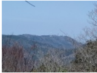
三国山のアンテナ群の先に白銀の霊峰御嶽山の遠望が、今日は春霞の中。