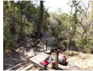
赤猿峠で何時もの様に細やかに非常食カロリーメイトと魔法ビンドリップコーヒーのランチタイム。