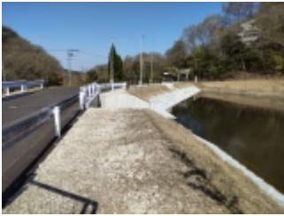
椀貸池堰堤の参道から白龍大王お社と整備工事された農業用灌漑池。