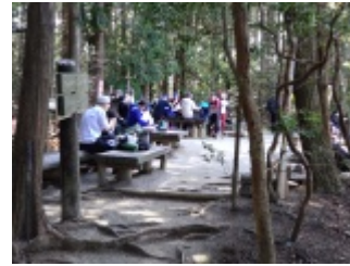
猿投山山頂はランチタイムで盛況、残念ながら春霞で展望はないが、温かい陽気はハイキング日和。