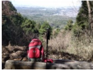
海上の森の物見山山頂から、瀬戸デジタルタワーの先に名古屋駅前高層ビル群。