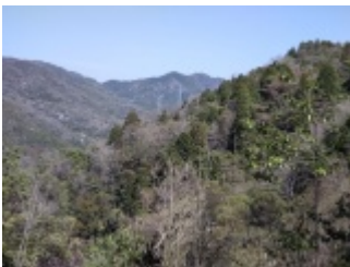
東海自然歩道の高圧鉄塔ベンチから折平山展望、公共交通機関では無理な山並みか。