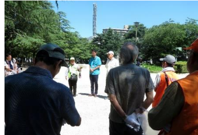
◇鯉城学園他の挨拶