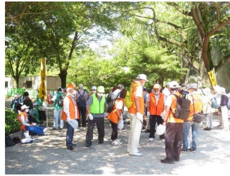
◇Cブロック(中村区・中区・昭和区・瑞穂区)の集合は「噴水」南側