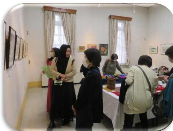
◇第3展示室は「工芸関係」の机上展示を絵画等の壁面展示と共に掲載。