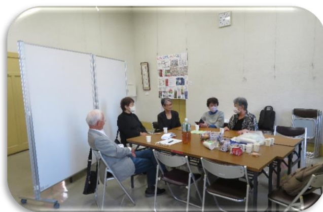
◇第2展示場は「行事アルバム」を平成31年9月から展示掲載。 ◇呈茶場でお茶を飲みながら談話が弾む。