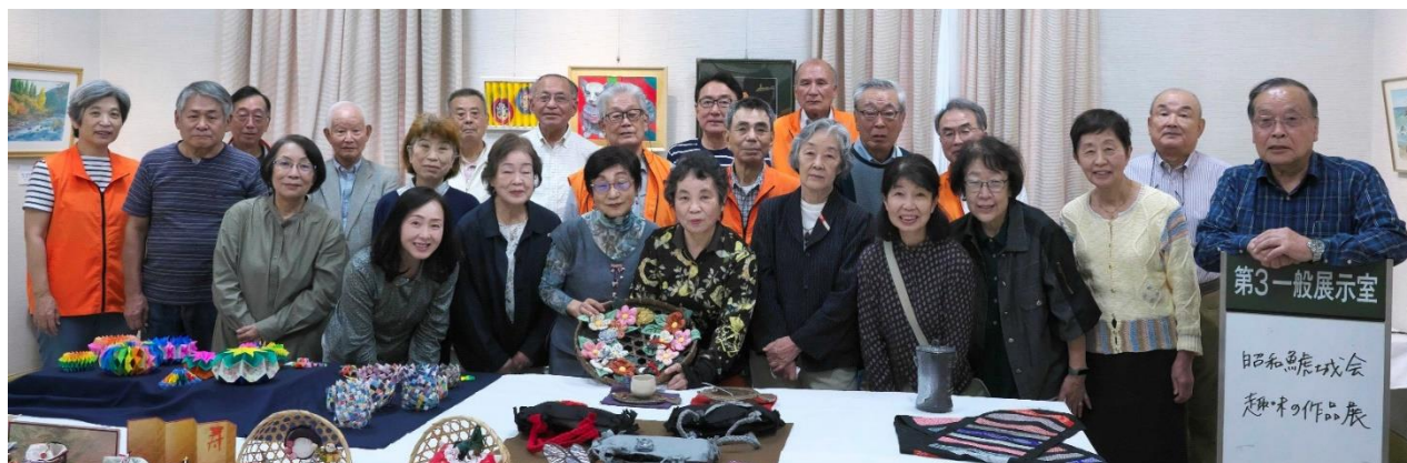
◇作品の撤収前に出展者の記念撮影