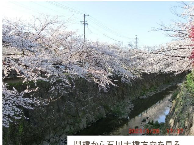
鼎橋から石川大橋方向を見る