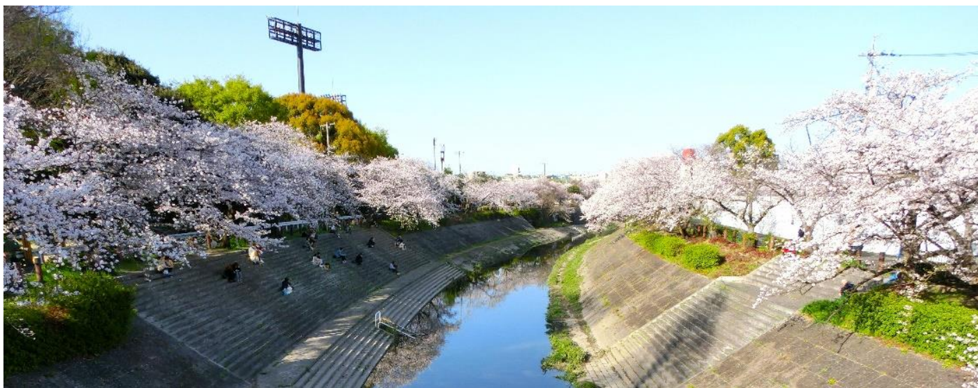
可和名橋から瑞穂橋方向を見る。左岸の瑞穂競技場は、アジア大会に備えて全面作り直し中です。