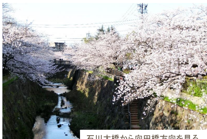
石川大橋から向田橋方向を見る