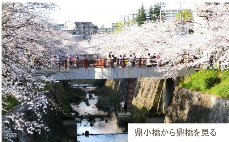
鼎小橋から鼎橋を見る