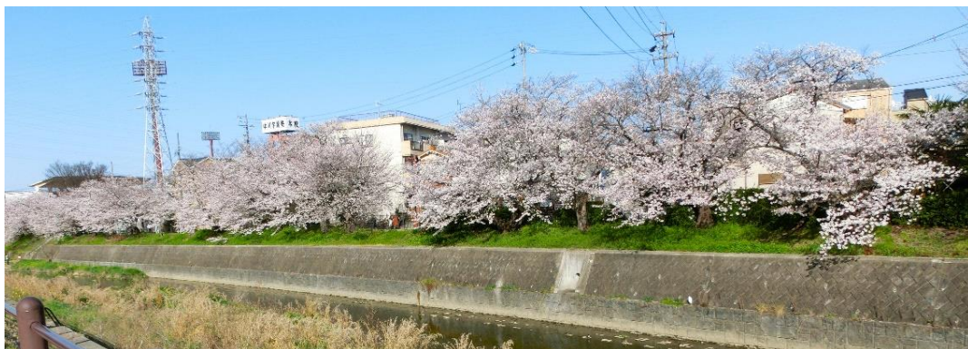
山下橋に向かう途中 右岸から左岸を見る