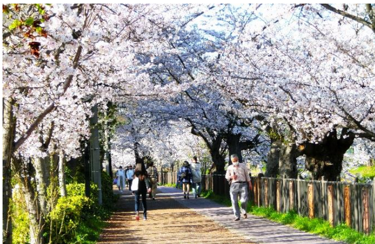
左右田橋から萩山橋に向かう右岸の桜