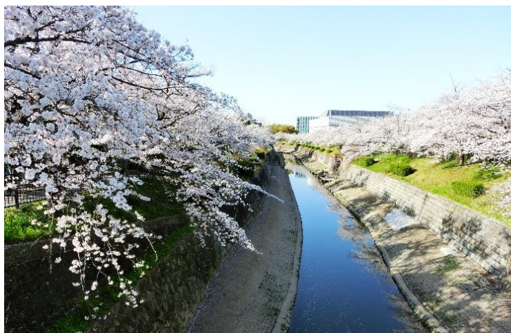
左右田橋から萩山橋方向を見る