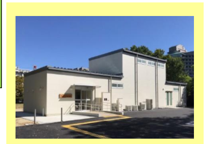
史実に忠実な復元「階段」体験館