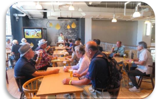
◇試飲コーナーで3種(一番搾り・二番搾り・黒ビール)のビールをグラスで試飲