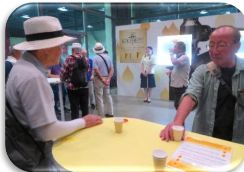
◇「一番搾り」と「二番搾り」飲み比べ