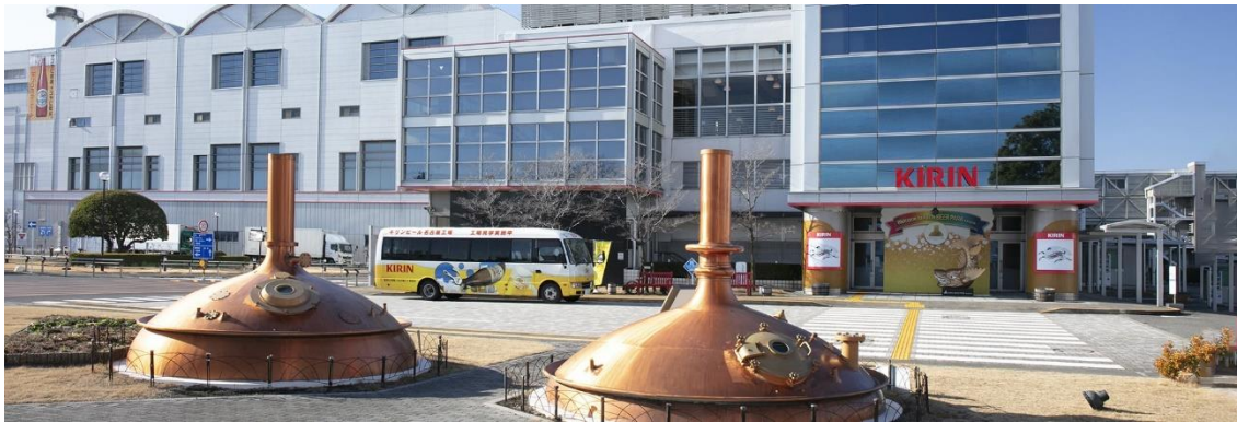
◇工場見学コース 建屋全景