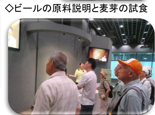
◇ビールの原料説明と麦芽の試食