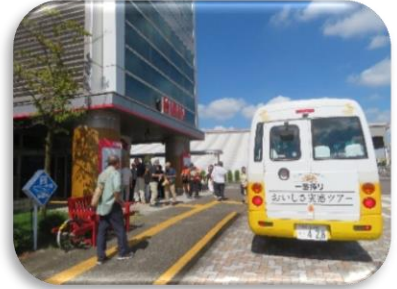
◇シャトルバス(30人乗りの工場到着