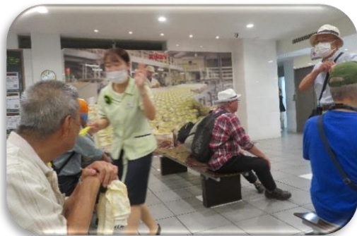
◇エントランスとガイドさん