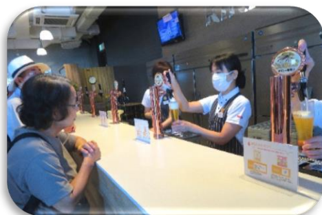
◇試飲室でビールサーバーから試飲