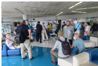
◇ポートビル 1F ロビー集合

ガーデンふ頭ポートビル集合→出港→稲永ふ頭→空見ふ頭→金城ふ頭→飛島ふ頭→高潮防波堤とポートアイランド→東海元浜ふ頭→ガーデンふ頭着