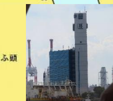
◇金城ふ頭の船舶通航情報C