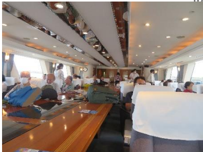
◇港務艇 1F キヤビン内