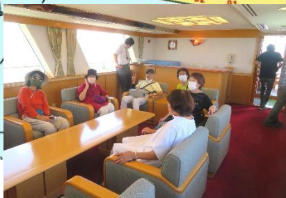
◇港務艇 2F キヤビン内