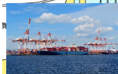
◇飛島ふ頭ガントリークレーン