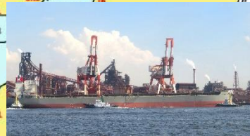
◇東海元浜ふ頭の鉱石運搬船