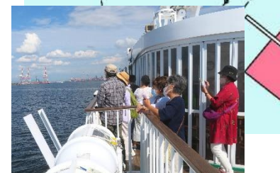
◇デッキから見る景観は最高