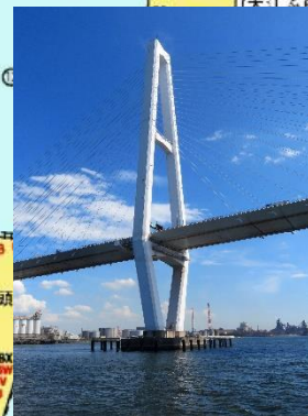
◇名港トリトン、高さ195m 新玉ふ頭