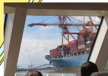
◇飛島ふ頭のコンテナ船、水深 16m