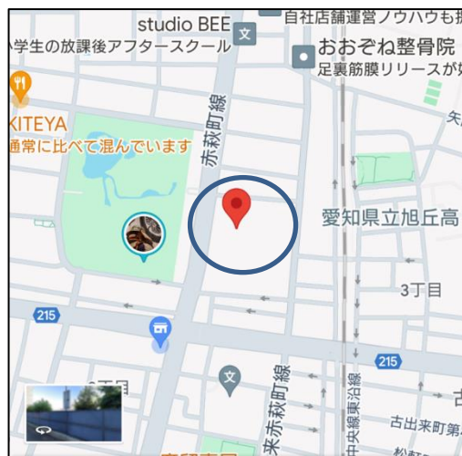
徳川明倫店の地図（徳川園の東）