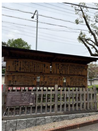
復元鳴海宿高札場