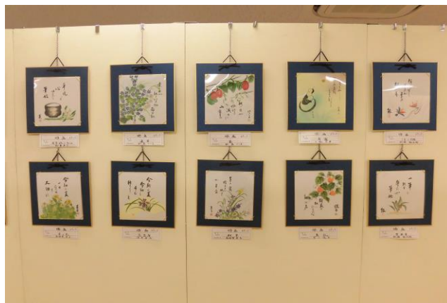
ピクチャーレール