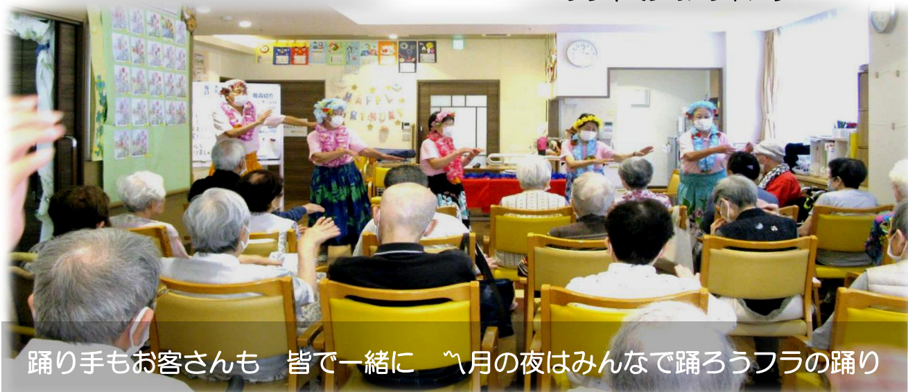
踊り手もお客さんも 皆で一緒に 〰月の夜はみんなで踊ろうフラの踊り