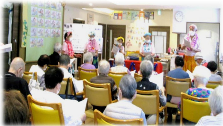
♪歌が大好きなお客さんとあの頃の歌を