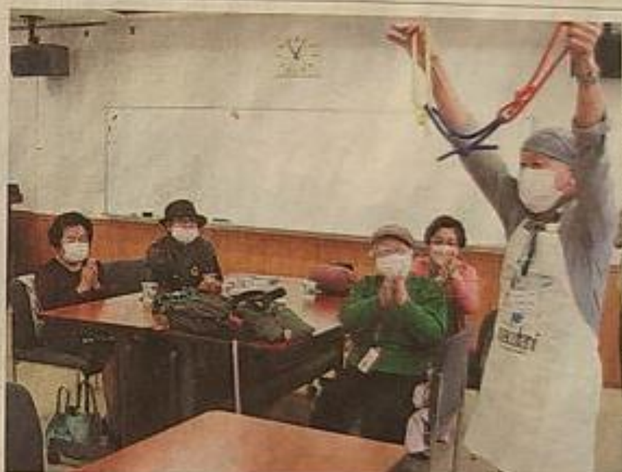
コーヒーを飲みながら、会員による手品を楽しむ来場者。千種区西崎町で