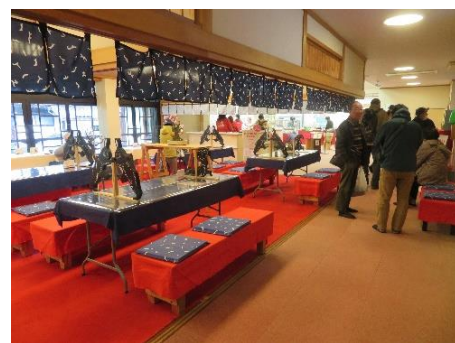
◇館内の喫茶店と売店