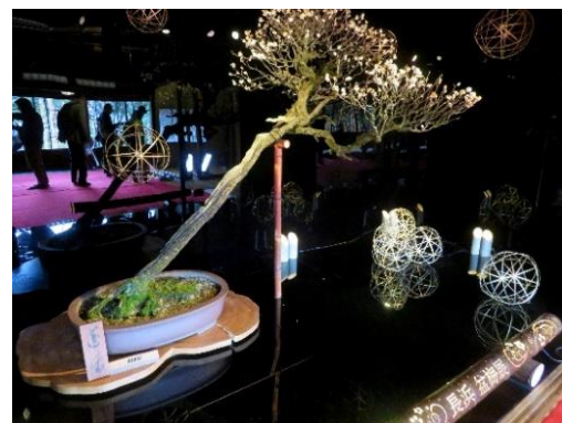
◇幻想的な照明と梅花