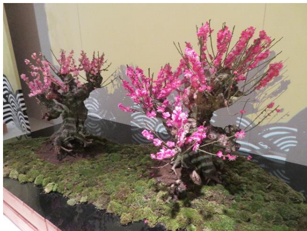
◇「竹生の双龍(CHIKUBU NO SOURYU)」樹齢 50 年