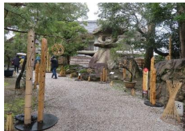
◇玄関アプローチに有る高さ 5m20t の巨大燈籠。