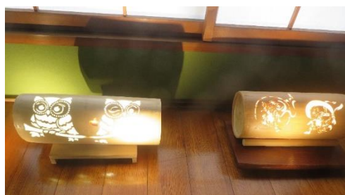
◇竹筒に彫刻の照明