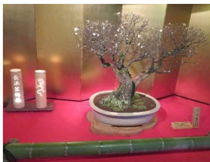
◇「阿分保乃(AKEBONO)」樹齢 100 年

◇第 73 回長浜盆梅展(24.01.10～03.10)は約 90 鉢を純和風の座敷にずらりと展示。高さ 3m 近い巨木や樹齢 400 年を超える古木も有る。