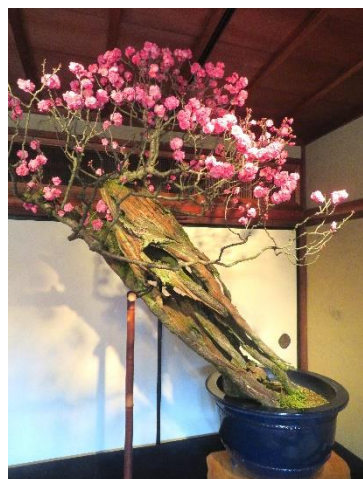
◇「不老(FURO)」樹齢 400 年