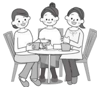
同期の友とおしゃべり