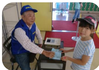
スタンプラリーも 子供の楽しみです。