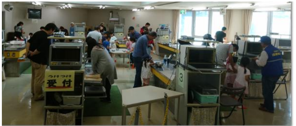
午後になると、4台の電子レンジもフル稼働