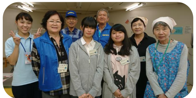
初体験のポップコーン作り、 丸一日 お疲れ様でした。