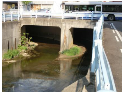
この暗渠は(出口)で、上の道路は 田代本通り4丁目、暗渠の(入口)は見附小学校の西側にある