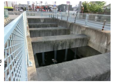
この暗渠は見附小学校の西側にある(入口)である。上の道路は鏡池通 2 丁目である。