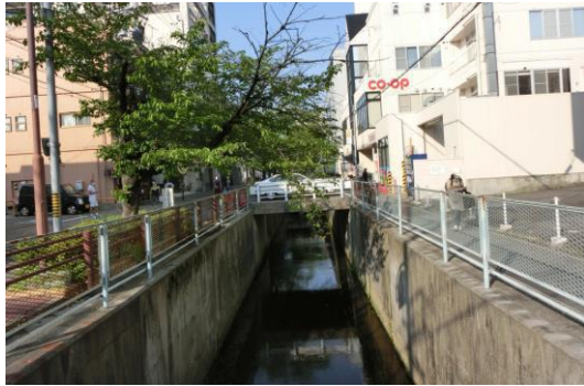
稲船 3 号橋から上流を望む。すぐ上流に写真右の暗渠がある。