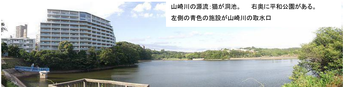
山崎川の源流:猫が洞池。 右奥に平和公園がある。左側の青色の施設が山崎川の取水口