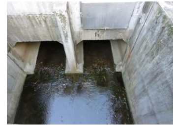
この暗渠の上は本山交差点で、猫が洞通りの下を流れ、猫が洞池に繋がる。