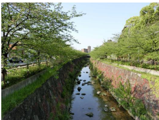
石川橋から上流を望む

そこで、ベルマウスとは異なる取水塔のような施設を見つけ。帰ってから、インターネットで再度調べると、山崎川の源流は取水塔で、ベルマウスは、オーバーフローした水を矢田川に流すための洪水対策施設であった。